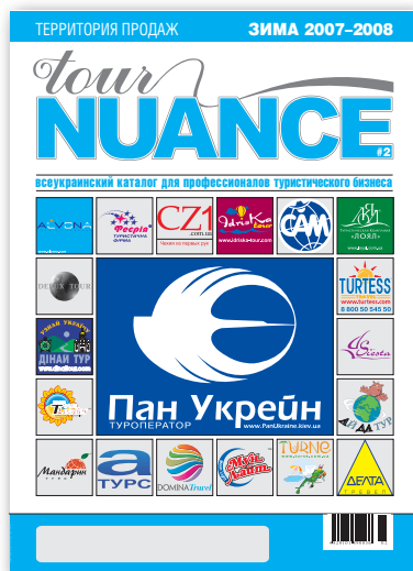
Tour Nuance № 2

03047, Киев-47, пр. Победы, 50 info@nuance.com.ua (44) 206 56 10