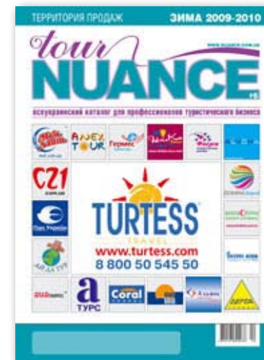
Tour Nuance № 6