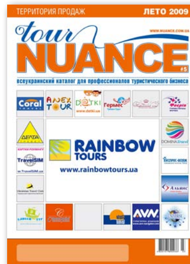
Tour Nuance № 5