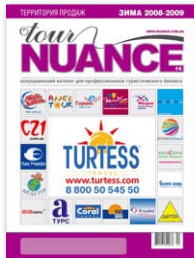
Tour Nuance № 4