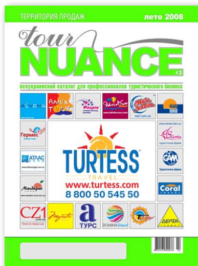
Tour Nuance № 3